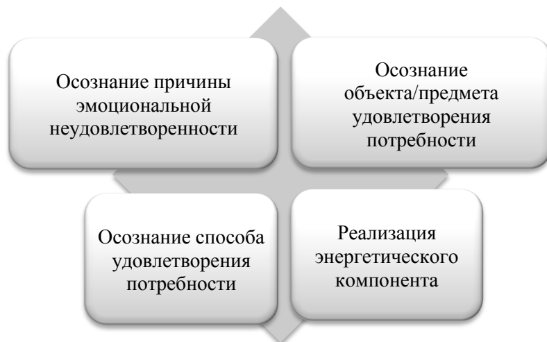
Рисунок 2. Схема внутренней архитектуры мотива [систематизировано и уточнено автором по источникам [18, 19, 17, 20] Figure 2. Diagram of the internal architectonics of the motif [systematized and clarified by the author according to sources [18, 19, 17, 20]

– заключительным элементом является энергетический компонент мотива, который реализуется в реальной деятельности, действиях и поступках, т.е. осознается, что нужно сделать в конкретной ситуации для снятия возникшей эмоциональной неудовлетворенности (рис. 2).