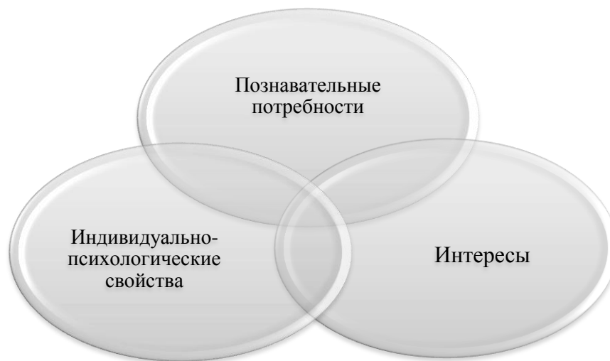
Рисунок 4. Психологический концепт мотивационного механизма образовательной деятельности (авторская разработка)

данный тезис использовать как логическую посылку, можно сделать заключение о том, что при рассмотрении вопросов стимулирования в сфере образовательной деятельности необходимо учитывать индивидуально-психологические особенности каждого его участника, с одной стороны, а также особенности окружающей среды – с другой.