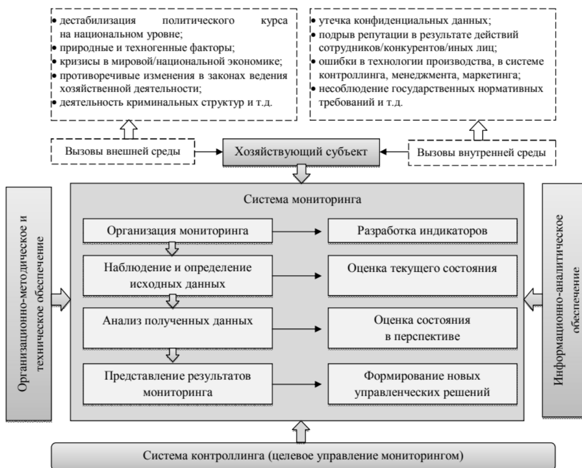
Рисунок 3. Концепция анализа и оценки экономической безопасности предприятия Figure 3. The concept of analysis and assessment of economic security of the enterprise