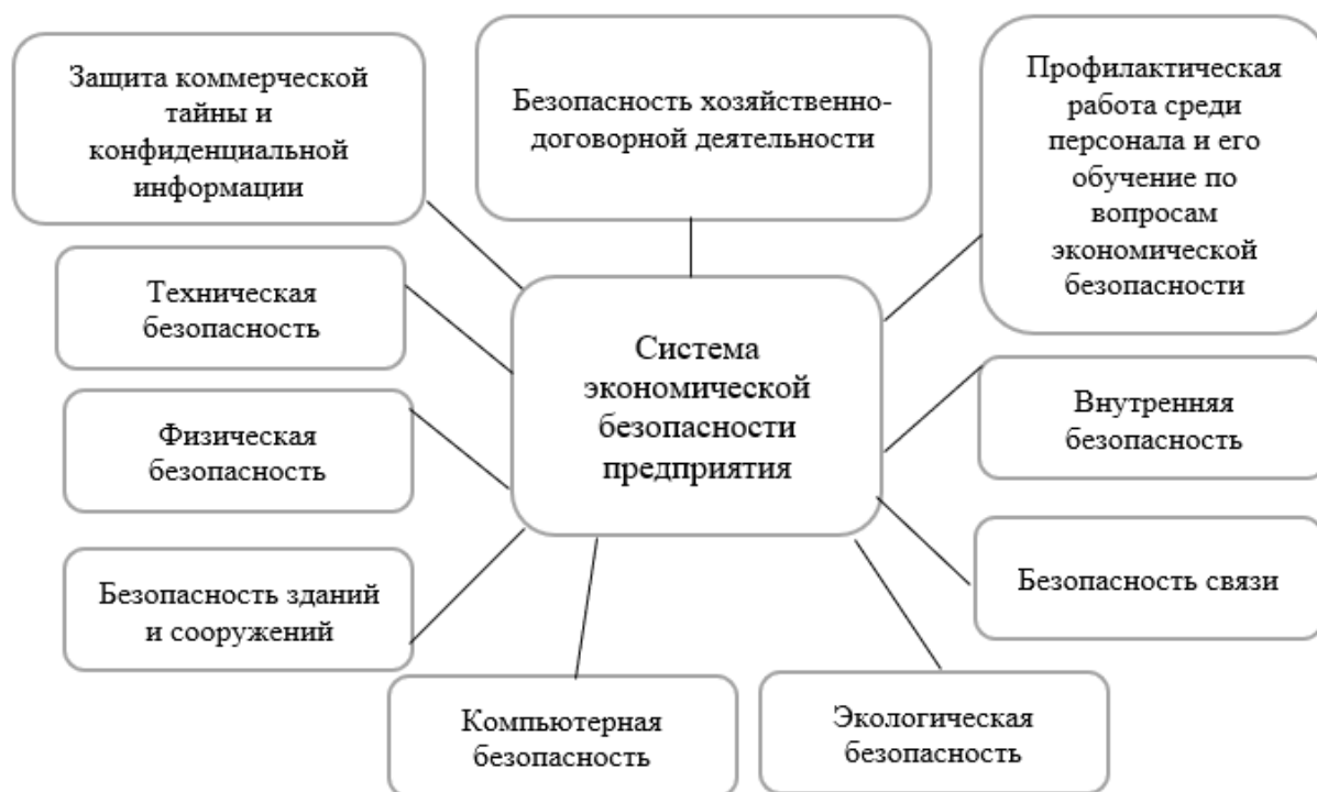
Рисунок 1. Основные компоненты системы экономической безопасности предприятия Figure 1. The main elements of the enterprise's economic security system

После изучения базовых задач управления системой экономической безопасности, можно перейти к более конкретной теме – этапам формирования,