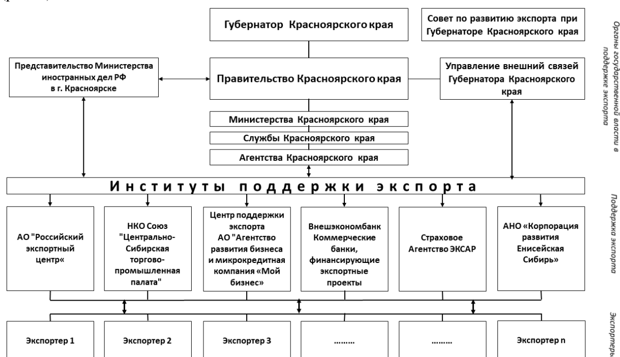
Рисунок 1. Вертикаль поддержки и развития экспорта РФ и Красноярском крае [составлено авторами]

При Губернаторе Красноярского края в 2021 г. создан Совет по развитию экспорта, курирующий данные аспекты внешнеэкономической региональной повестки (рис. 1).