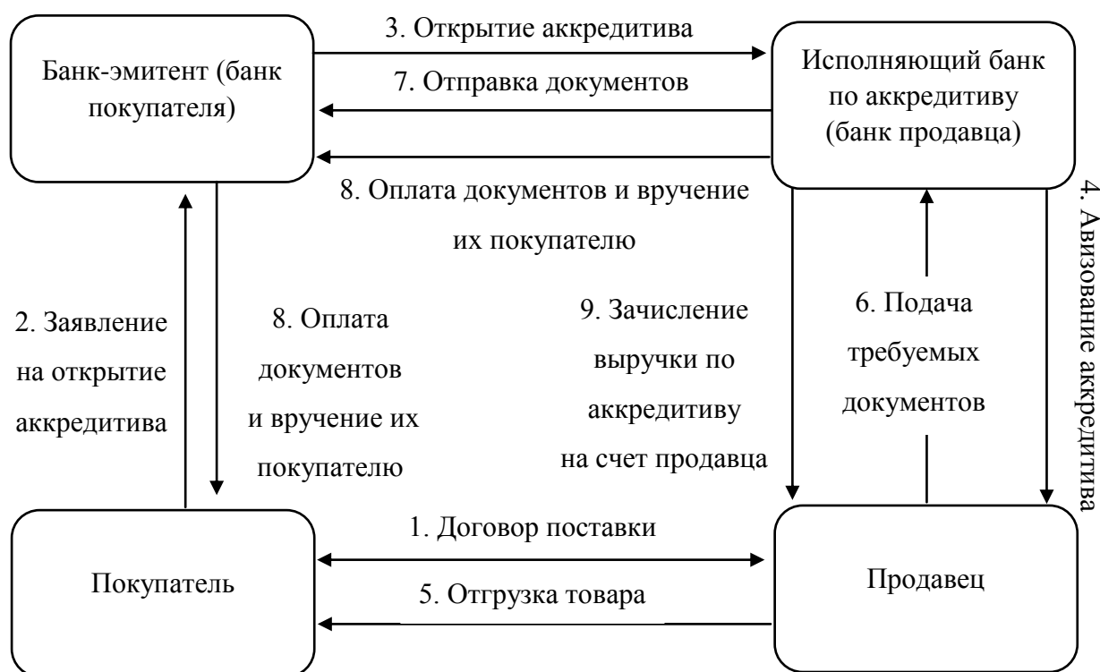
Рисунок 1. Схема расчетов по аккредитиву Figure 1. Settlement scheme for a letter of credit

На рис. 1 наглядно продемонстрирована схема расчетов по аккредитиву.