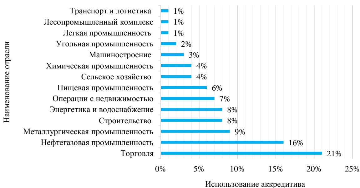
Рисунок 3. Использование аккредитива в Российской Федерации по отраслям за 2020-2022 гг.

В процессе исследования был проведен анализ практики использования аккредитива в Российской Федерации в 2020-2022 гг. В качестве материалов для анализа выступили статистические данные, размещенные на официальном сайте ПАО «Сбербанк». Установлено, что на текущий момент в Российской Федерации расчеты по аккредитиву осуществляются в различных отраслях (рис. 3).